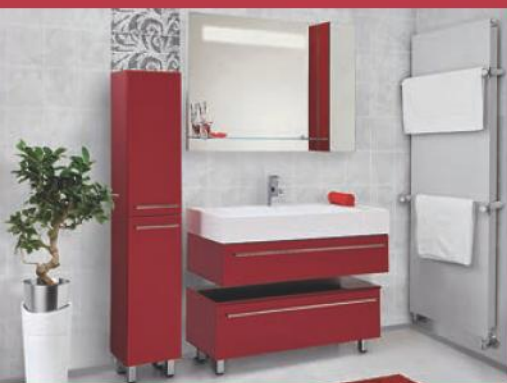
Водные процедуры — мебель для ванной