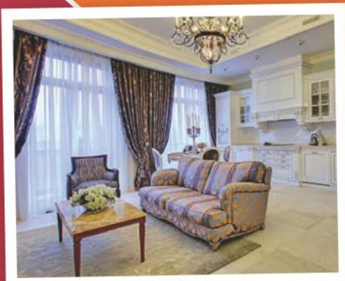
Бархатный сезон в полукруглой квартире